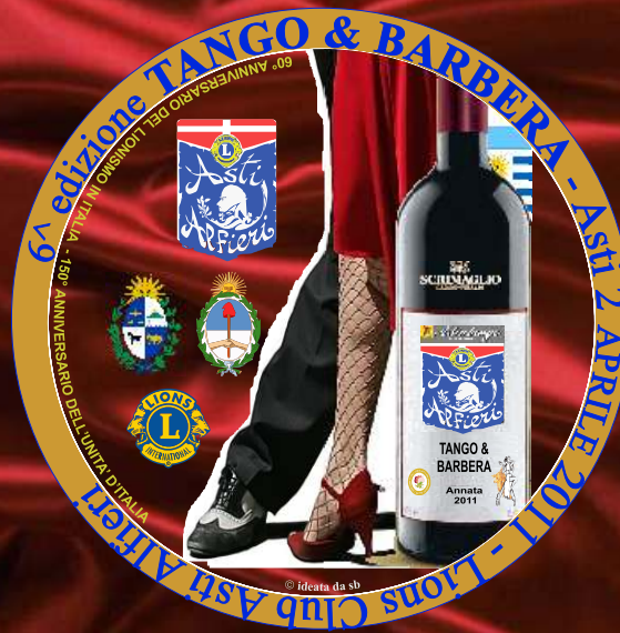
La pin commemorativa della serata

C apita che scegliendo una certa location per un evento si debba fare i conti con l'età della stessa e, inevitabilmente, con gli "acciacchi" che anche all'improvviso possono manifestarsi. Ecco che a noi è capitato: il Centro Culturale Giraudi (ex chiesa sconsacrata di San Martino) ha deciso di far sentire i suoi quasi 350 anni -l'inizio dei lavori è del 1660- con qualche colpo di tosse e di intonaco (in un'area che comunque non avrebbe interessato la nostra serata) per richiamare l'attenzione. Con il dovuto