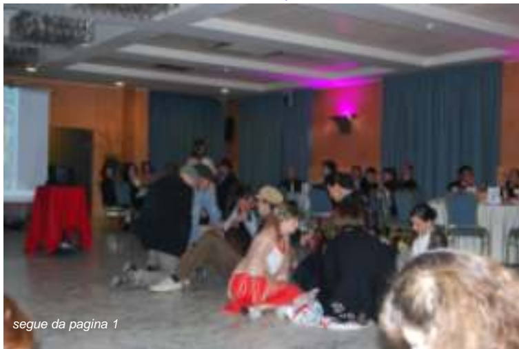
segue da pagina 1

"Astintango" e la compagnia teatrale "in...cosciente gente" hanno conivolto i partecipanti mentre la Barbera delle cantine Scrimaglio di Nizza Monferrato ha fatto la sua parte sui tavoli dei commensali in una edizione riservata e limitata creata appositamente per la serata