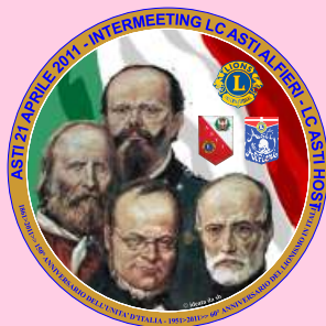
IL LOGO DELLA CONFERENZA