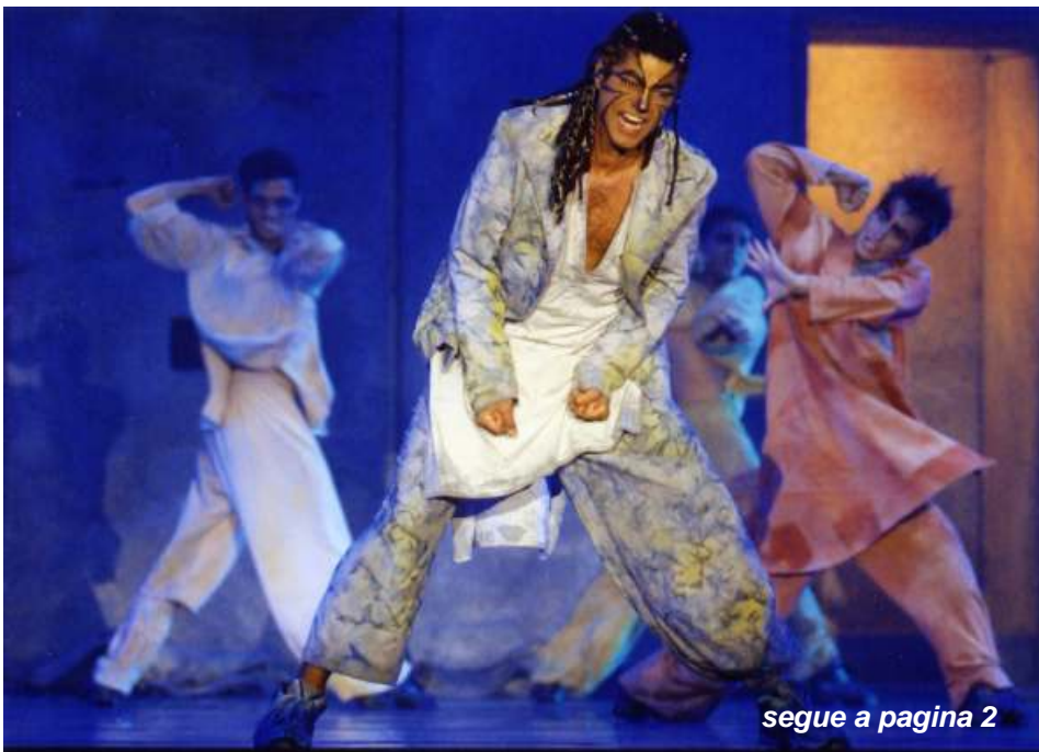
segue a pagina 2