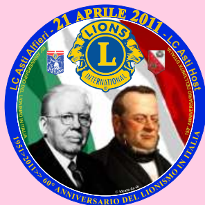
LA PIN COMMEMORATIVA DELLA SERATA