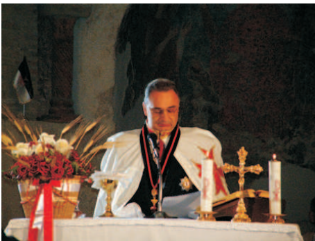
S.E. il Gran Maestro Intenazionale dell'O.S.M.T.J.

Il 17 novembre il Gran Maestro si recherà per la seconda volta a Gerusalemme per la Messa all'interno del Santo Sepolcro ma, soprattutto, per farsi accreditare presso le Ambasciate perché è in procinto di far realizzare un monumento alla distruzione dei Templari operata da Saladino.