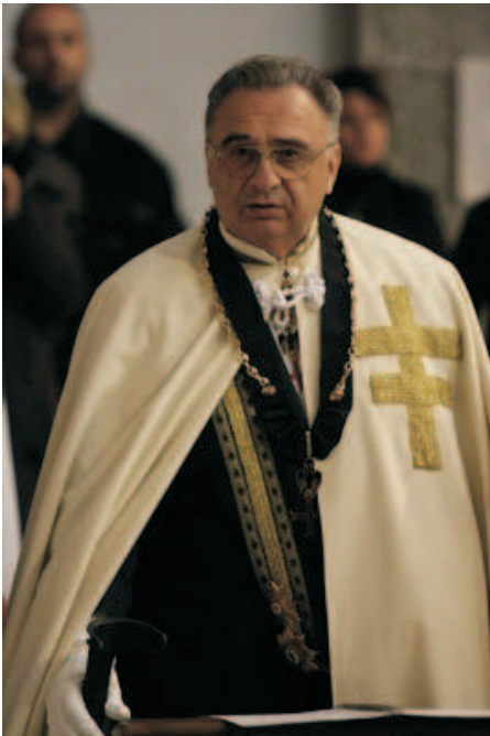
S.E. il Gran Maestro Intenazionale dell'O.S.M.T.J.

In questi luoghi vi sono delle costruzioni e punti "classici" Templari. Il Gran Maestro ha mostrato una chiesa che riporta simboli dell'Ordine e la Madonna Nera detta "Madonna dell'Olmo"; l'Olmo era una divisione dei Cavalieri Templari.