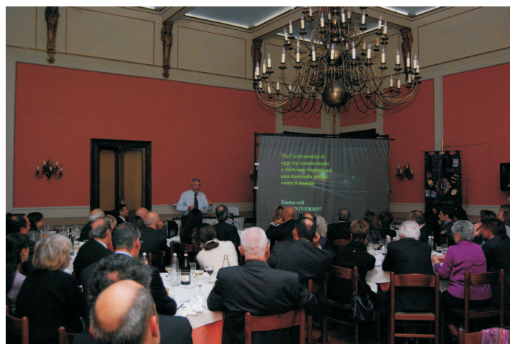
Il Prof. Giovanni Bignami "in azione"

Dietro l'angolo ci sono scoperte importanti, che getteranno luce anche sull'altro grande enigma: com'è nata la vita sulla Terra? Si parte dal Big Bang e si arriva al bipede implume. Si passa attraverso la creazione di luce e materia, poi di stelle, galassie e pianeti, fino al nostro sistema planetario. Per il quale si presenta una nuova astronomia, la "astronomia di contatto". E' l'Universo che viene a trovarci: ogni anno cadono sulla Terra ca. 40000 tonnellate di materia extraterrestre,