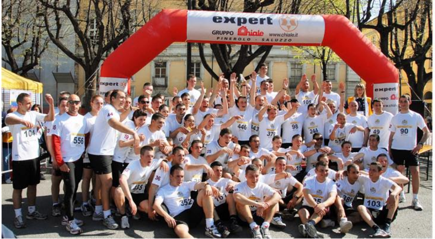
I Dragoni del Nizza Cavalleria, il Gruppo più numeroso.