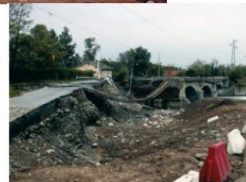
Il ponte ferroviario sul Chisone distrutto dalla piena