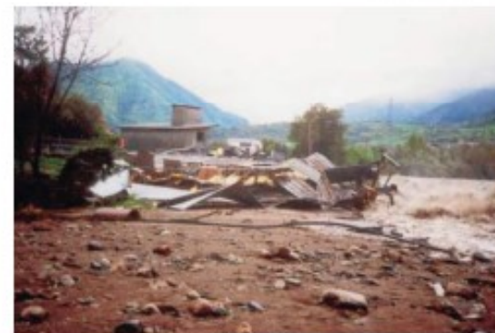
I resti del Centro Sociale dopo il passaggio dell'acqua nell'ottobre 2000