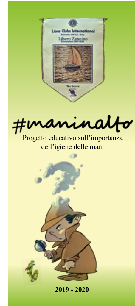
Il progetto, ideato da Salvatore Piazza, è sostenuto da 10 club Lions del distretto 108 Ia1.

Dal 2016 a tutt'oggi, il progetto è stato attuato in 21 scuole primarie (127 classi) e 3 scuole dell'infanzia (4 classi) di Torino e provincia per un totale di 2500 bambini "educati" alla corretta igiene delle mani. Per informazioni: Salvatore Piazza tel. 3470110602 - mail: salpiazza@yahoo.it